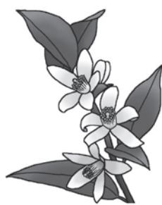
徳島県の花(酢橘の花)